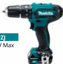
HP333DZJ CXT 12 V Max

Tevens zijn er echte allround accu klopboormachines met een optimale verhouding tussen prestaties en het gewicht. Ben je op zoek naar een machine voor zwaardere bewerkingen en wil je langer doorwerken? Kies dan voor HP001GZ op het XGT 40 V Max accu platform.