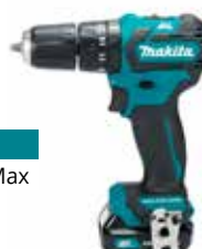
HP332DZJ CXT 12 V Max