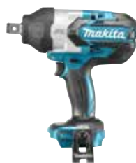
TW001GZ 20 XGT 40 V Max punten

3/4" vierkant aansluiting. Zware verbindingen (M12-M30). 1250 Nm. €395**