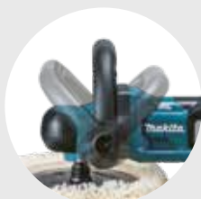
Beugelhandgreep is in drie posities instelbaar.