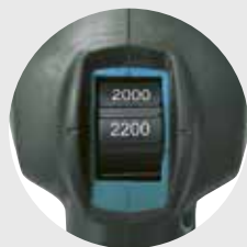
Variabele toerenregeling instelbaar middels een draaiknop op basis van de toepassing.