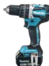
DHP484ZJ LXT 18 V