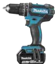
DHP482ZJ LXT 18 V