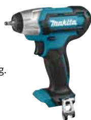
TW160DZJ CXT 12 V Max

1/4" vierkant aansluiting. Lichte verbindingen (tot M10). 60 Nm. €109*