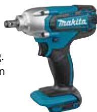
DTW300ZJ 10 LXT 18 V punten

1/2" vierkant aansluiting. Gemiddelde verbindingen (M6-M14). 190 Nm. €135**