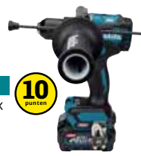
HP001GZ XGT 40 V Max