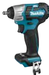
DTW180ZJ LXT 18 V

3/8" vierkant aansluiting. Lichtere verbindingen (M6-M12). 160 Nm. €155*