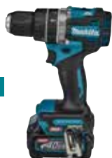
HP002GZ XGT 40 V Max