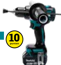
DHP486ZJ LXT 18 V