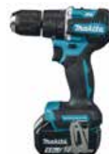
DHP487ZJ LXT 18 V