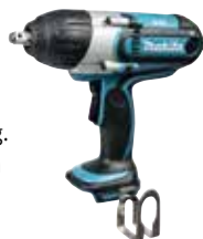
DTW700ZJ 20 LXT 18 V punten

1/2" vierkant aansluiting. Zwaardere verbindingen (tot M22). 440 Nm. €339**