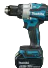
DHP489ZJ LXT 18 V